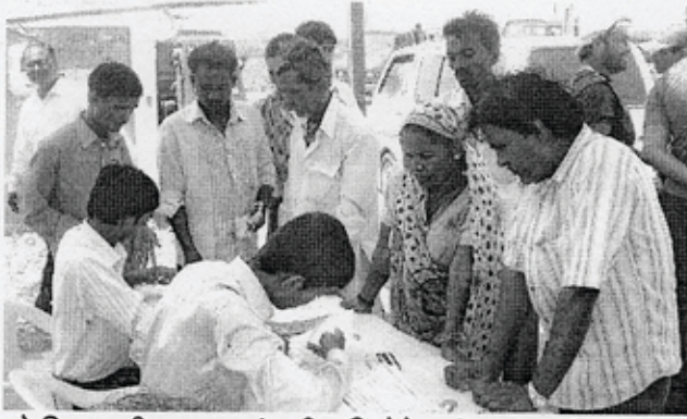
ડ્રો સિસ્ટમથી ઘર આપ્યાં પછી શ્રમિકોને ત્યાં વસાવવા ઉપરાંત નવા ઘરમાં રહેવા ગયા ત્યારે ભોજનસમારંભ પણ ચોજ્યા!