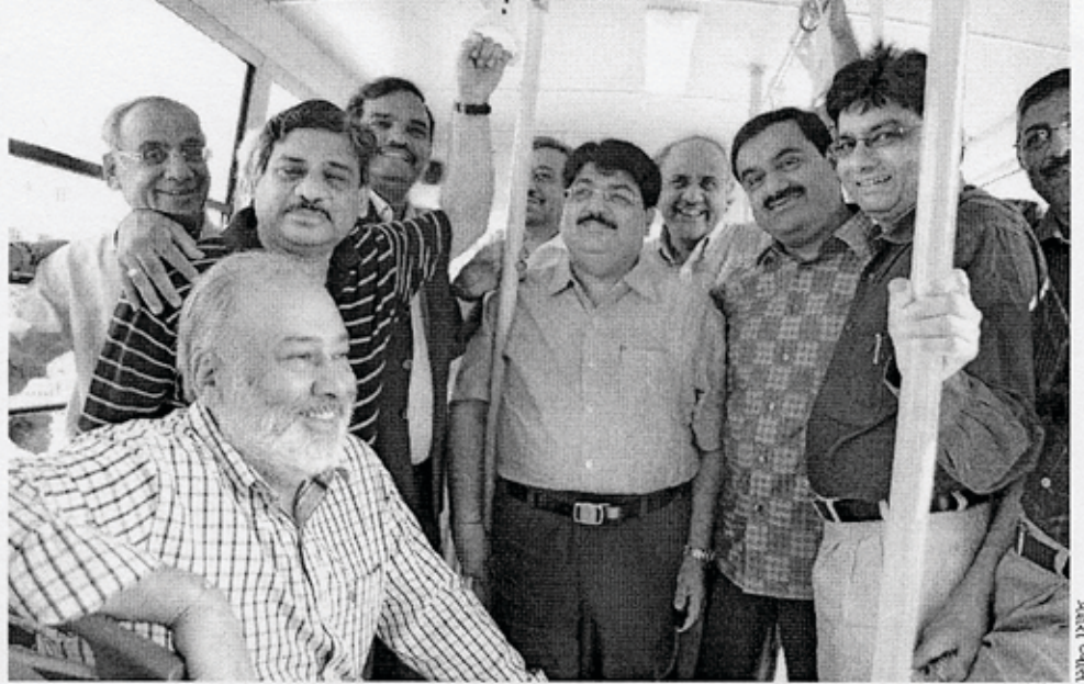
ટ્રાયલ સ્પ દરમિયાન ગુજરાતની અગ્રણી વ્યક્તિઓએ આ બસમાં પ્રવાસ કરીને પોતાનાં સૂચન આપ્યાં.

ટ્રાયલ સ્પ માટે ખુલ્લો મૂક્યો. લોકોનાં સૂચન મગાવ્યાં. માત્ર મગાવ્યાં જ નહીં, લોકોના અનુભવ પણ ધ્યાનમાં લીધા. આ પ્રોજેક્ટ માટે કોલમ્બિયાના બગોટા શહેરમાં ચાલતી બીઆરટીએસ સેવાનું મોડેલ અપનાવવામાં આવ્યું છે, પણ એમાં સ્થાનિક લોકો અને આ ક્ષેત્રના નિષ્ણાતોનાં સૂચન લઈને અહીંની જરૂરિયાત પ્રમાણે ફેરફાર પણ કર્યાં છે. શરૂઆતમાં એક બસસ્ટેન્ડ બગોટાના મોડેલ પ્રમાણે સ્ટીલ મટીરિયલમાંથી બનાવવામાં આવ્યું, પરંતુ અમદાવાદ અને બગોટાના સરેરાશ તાપમાનને ધ્યાનમાં લેતાં અમુક ફેરફાર કરવાનાં સૂચન મળ્યાં એટલે કોન્ક્રીટનો પણ ઉપયોગ કરવામાં આવ્યો.